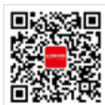
中国政府采购杂志社订阅号