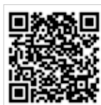
中国政府采购杂志社微店